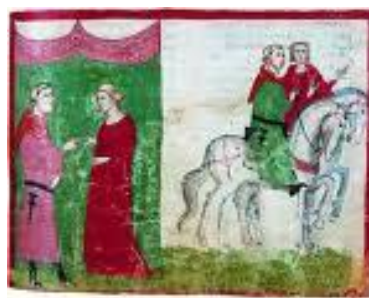
Heirat Welf V. und Mathilde v. Tuszien